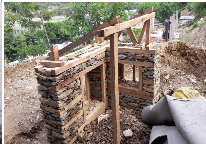
भुकम्प प्रतिरोधात्मक घर निर्माण तालिम