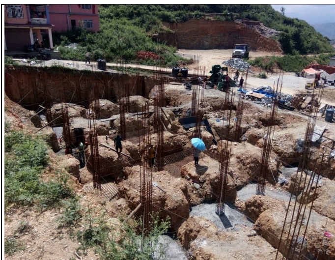
भवन निर्माण स्थल