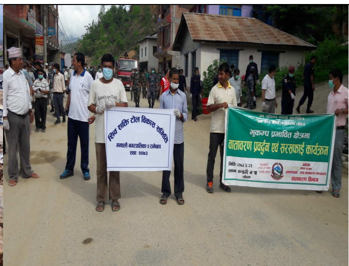
कार्यक्रम तथा योजना संचालनको अवस्था