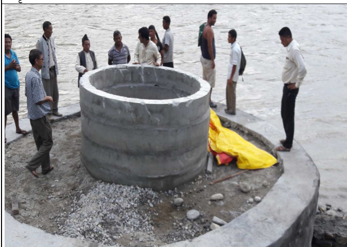
तामाकोशि लिफ्ट खानेपानी योजना म.न.पा १६