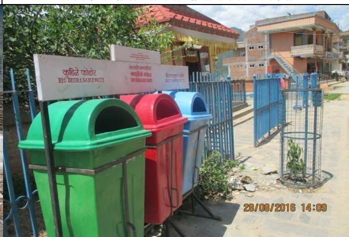
सरसफाई योजना तथा कार्यक्रम संचालन