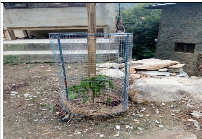
वृक्षारोपण कार्यक्रम संचालन